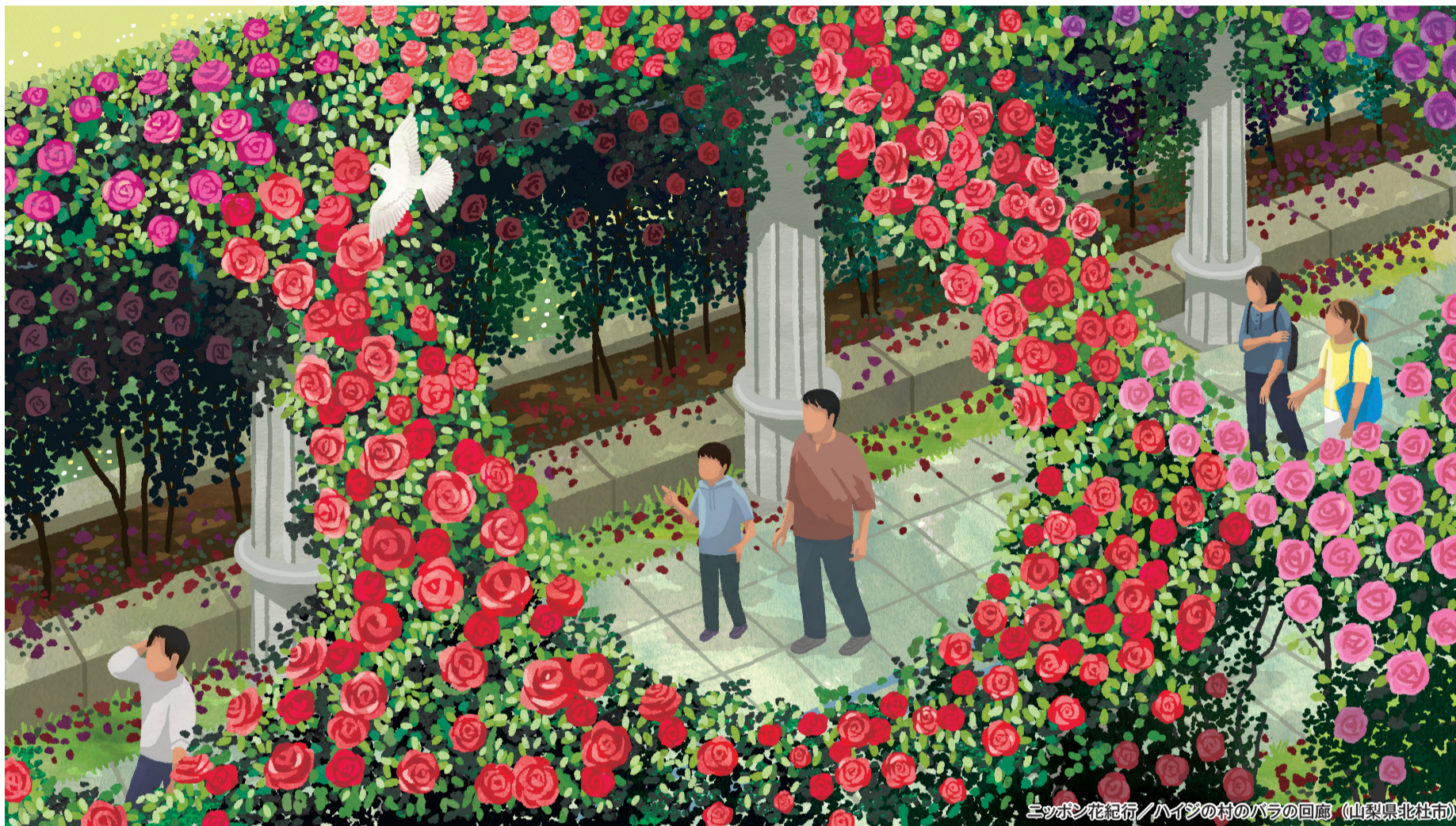
ニッポン花紀行/ハイジの村のバラの回廊 (山梨県北杜市)